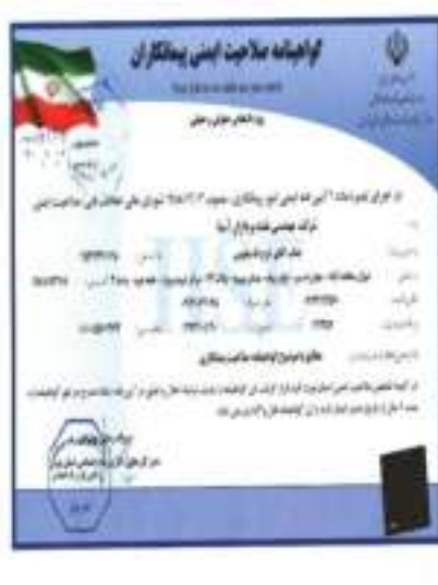
گواهینامه صلاحیت ایمنی پیمانکاران