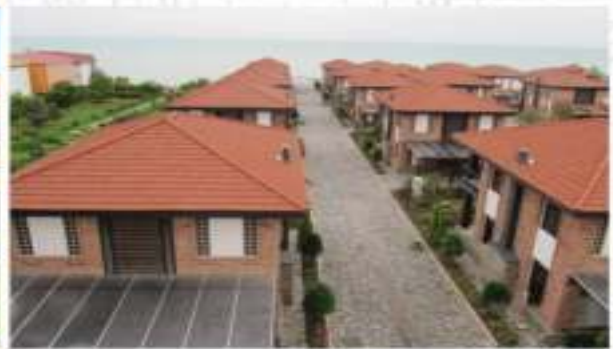
شهرک ساحلی اکباتان

شهرک ساحلی اکباتان یکی از زیباترین شهرک های مازندران در شهر محمودآباد با چشم انداز دریای خزر با تعداد حدود ۴۰ بلوک ویلایی به پایان رسیده است. پروژه شهرک ساحلی اکباتان با زیربنای بالغ بر ۱۲،۰۰۰ مترمربع با امکانات رفاهی مناسب با فضایی همراه با آرامش و آسایش را برای ساکنان مهیا نموده است.