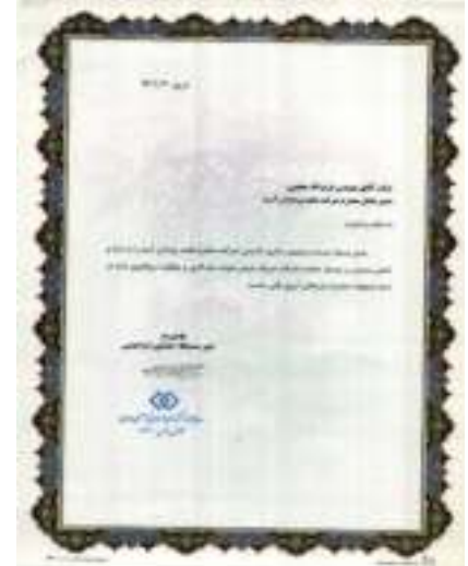
سندیکای شرکت های تاسیساتی و صنعتی ایران