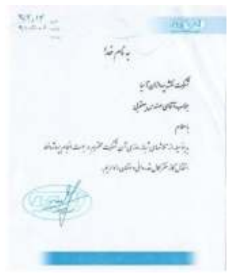
شرکت آبرون مختصات جنوب