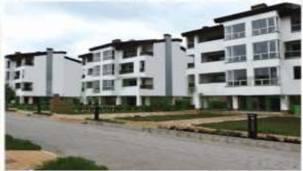
شهرک ساحلی اکباتان