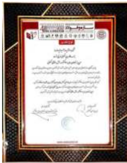
گواهینامه صلاحیت ایمنی پیمانکاران