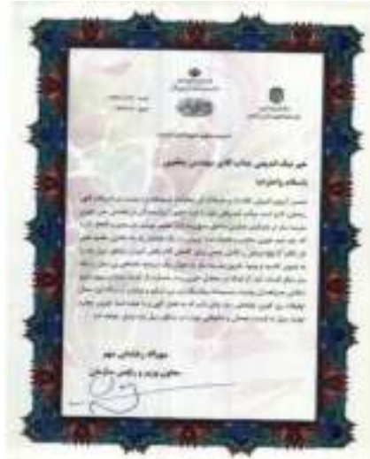
وزارت آموزش و پرورش