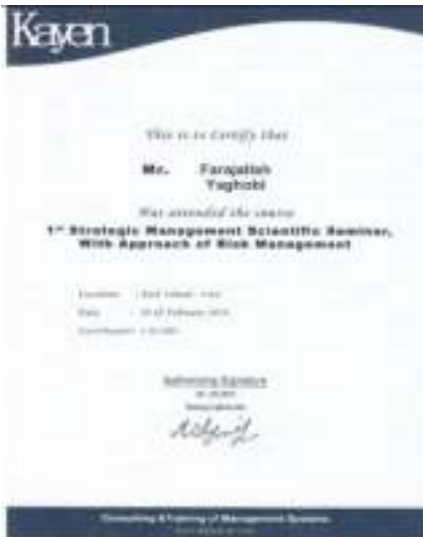
سمینار علمی مدیریت استراتژیک با رویکرد مدیریت ریسک