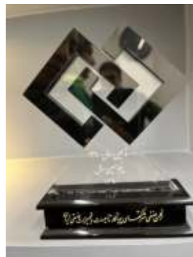
صنف شرکتهای پیمانکار تاسیسات و تجهیزات صنعتی ایران