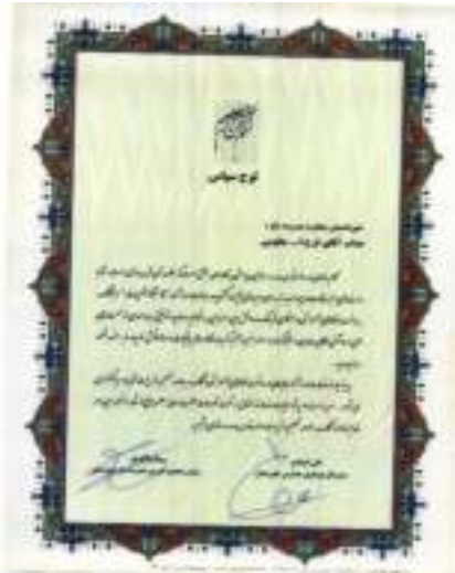
نوسازی مدارس خوزستان