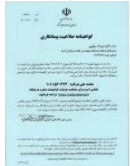
گواهینامه صلاحیت پیمانکاری