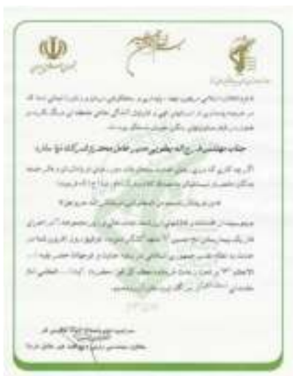
معاونت مهندسی نرسا