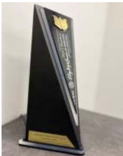
کنفرانس بین المللی سازه فولاد